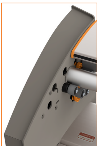
Намотка на лёгкий алюминиевый вал или свободный выпуск бумаги